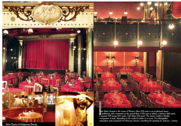
Sabat Theatre of Malgorzata Paszka

Музыкальные представления в данном театре проходят по четвергам, пятницам и субботам. До начала каждого музыкального представления гости театра приглашаются на ужин, который накрыт в банкетном зале. Продолжительность музыкального шоу длится около 2,5 часа. Во время музыкального